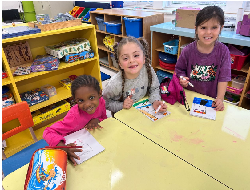
Figure 3 : construction de livres par les «enfants auteurs»