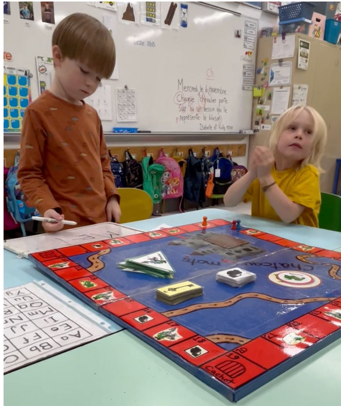
Figure 7 : jeu de règle Le château des mots conçu par Vicky Dumont

Dans une classe comme celle de madame Vicky Dumont, l'écrit s'enclasse dans tous les ateliers du quotidien. Naturellement, les enfants importent l'écrit dans l'espace de jeu de construction ou de jeu symbolique parce que l'enseignante rend l'écrit nécessaire et disponible. Les deux photos présentées dans la figure 8 montrent, à gauche, un petit garçon qui a participé à la construction d'un château hanté avec les blocs. Il voulait absolument faire une affiche pour indiquer «bienvenu dans le château hanté», ce qu'il a spontanément écrit à sa manière. Puis la photo de droite montre comment le coin de jeu symbolique, le château de la classe, a été pris d'assaut par les sorciers qui remplissaient leurs grimoires de recettes maléfiques à écrire et à préparer !