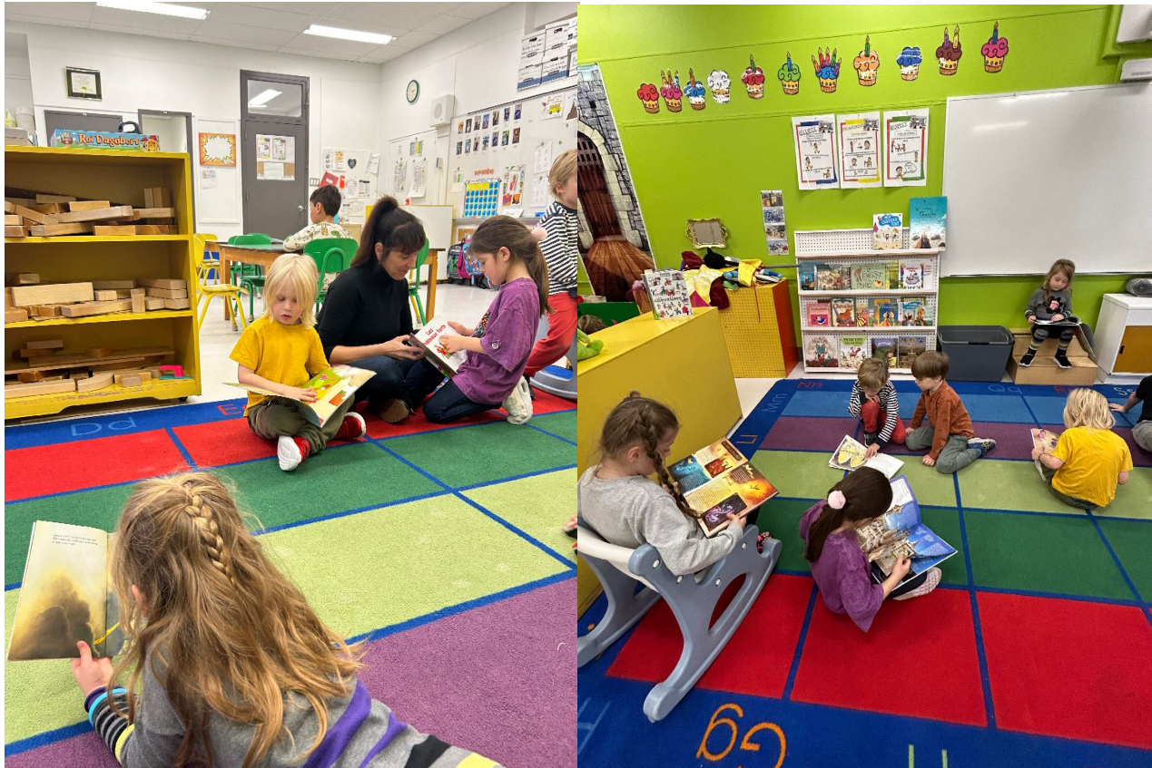
Figure 1 : sélection de la littérature d'enfance-univers du Moyen-Âge