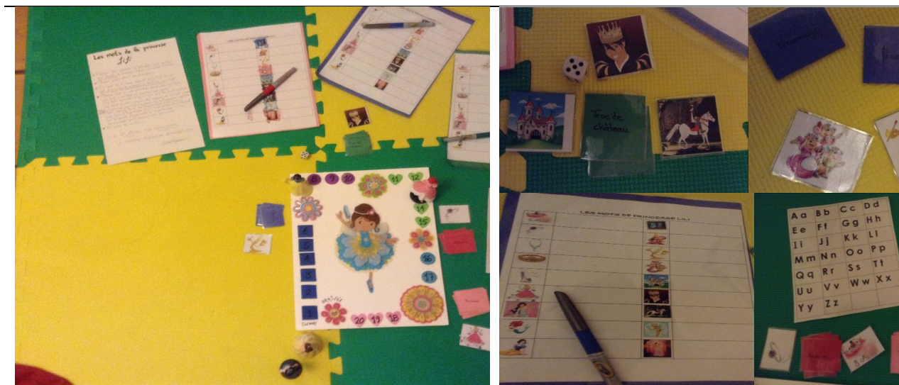
Figure 6 : jeux de règles convoquant les écritures provisoires des enfants

Dans le jeu, Le château des mots , qui suit à la figure 7, élaboré par madame Vicky Dumont, les enfants ont à avancer leur pion respectif à travers un parcours de 27 cases. Chaque case dirige l'enfant vers l'une des pioches placées au centre. L'enfant retourne une carte de la pioche indiquée sur la case où il s'arrête, dénomme l'objet issu des châteaux, et doit l'écrire sur un tableau blanc. Dans la photo de la figure 7, l'enfant avait pris une carte de la pioche «chevalier» qui concerne tout l'équipement digne d'un chevalier. Sur la carte piochée, on voyait des «bottes». On voit que l'enfant a écrit «MET» sur son tableau blanc. La lettre «M» a été mise pour le phonème [b]. Cette confusion n'est pas rare chez les petits les phonèmes [m] et [b] s'articulant exactement au même endroit en bouche. La lettre «E» est mise pour le phonème [ɔ] et la lettre «T» est écrite pour le phonème [t]. En maternelle, déjà, dans un contexte extrêmement ludique où les enfants ont joué entre eux tous les jours, on voit que l'enfant en est déjà à une représentation alphabétique du code, fondement nécessaire pour pouvoir amorcer la lecture autonome.