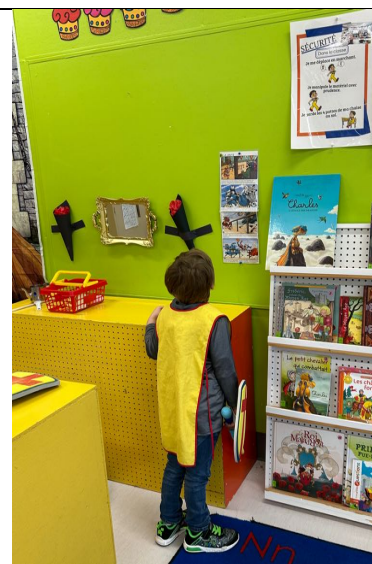
Figure 4 : différents scénarios élaborés par les enfants en contextes de jeux symboliques