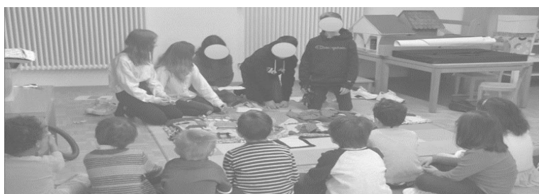
Figure 4 : les élèves de 8H présentent leurs créations textuelles aux 2H

Inspirés, les élèves de Marie offriront à leur tour aux 8H une présentation d'un conte issu de leur imagination, au moyen du tapis, plus tard dans l'année scolaire. De part et d'autre, la matérialité de l'artefact semble avoir principalement suscité création et apprentissages. Au niveau disciplinaire, ils touchent à tous les axes thématiques du PER.