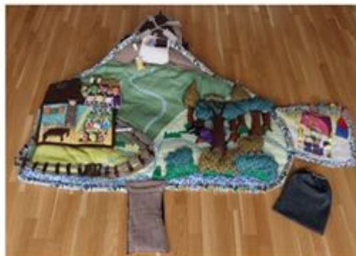
Figure 1 : Tapis à histoires, création inédite pour la HEP-BEJUNE

Qu'est-ce au juste que ce « tapis à histoires » ? Confectionné artisanalement et disponible à la médiathèque, il s'agit d'un support en tissu de grande dimension. Déployé, il mesure 1m98 sur 1m54. Il reproduit donc le décor de Le loup et les sept chevreaux , proche de la version traditionnelle du conte diffusée principalement par les Frères Grimm dans les Contes de l'enfance et du foyer en 1812 et devenue une des références patrimoniales du genre. Cet artefact est accompagné d'une série d'accessoires permettant, à travers leur manipulation en parallèle à celle du tapis lui-même, de raconter l'histoire en question tout en produisant un accompagnement visuel animé. Le tapis donne à voir différents lieux représentés dans le récit (maison des sept chevreaux et son mobilier, prairie, puits, cours d'eau, forêt, moulin, étal d'un marchand, chemins, village). Certains éléments sont amovibles (barrière, façade, porte, fenêtres), permettant à d'autres d'apparaître, comme l'intérieur de la maison et son horloge, elle-même possédant une porte. Différents personnages et objets complémentaires sont disponibles (un loup, sept chevreaux, un sac de farine, un gant blanc, des fruits et légumes, trois craies de couleurs blanche, rouge, bleue). Une liste de tous les objets accompagne le tapis à des fins de vérification de son contenu.