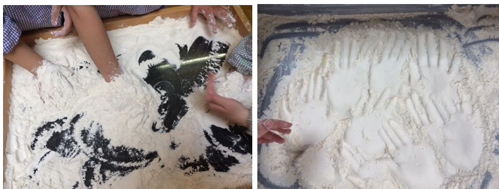
Figure 5 : Atelier farine pour travailler l'expression « Montrer patte blanche »