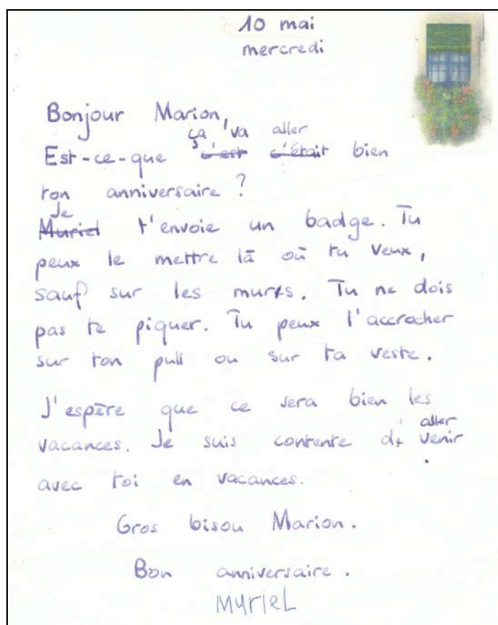
Document 1: Lettre de Muriel, dictée à l'enseignante

prochainement : le dictée s'effectue le 10 mai et le jour d'anniversaire est le 12 (voir document 1). En tout, relecture comprise, la dictée dure trente minutes environ. Il s'agit d'une dictée à l'adulte individuelle.